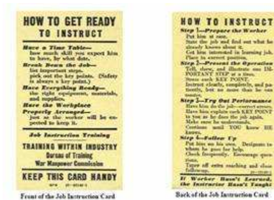
Figura 1: Cartão de Instrução de Trabalho do TWI