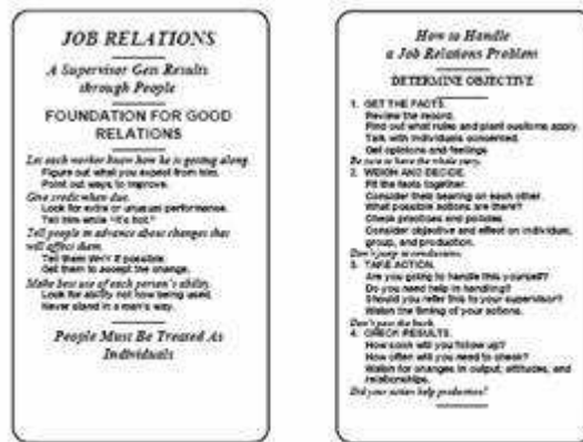
Front and Back of the Job Relations Card