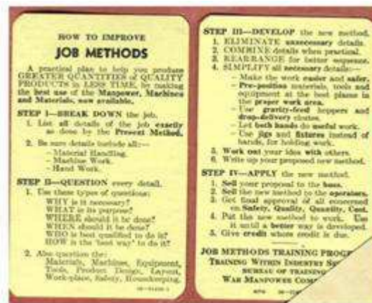
Front and Back of the Job Methods Card